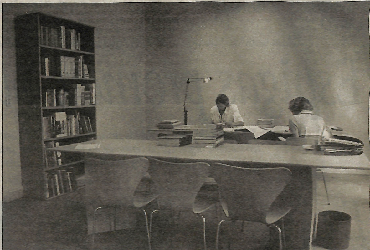
Desde su reciente mudanza, en Espigas los interesados pueden trabajar más cómodamente.

MH: -Con esto, estamos trabajando con cosas que se producen contemporáneamente, o sea, estar en las formas aggravadas de los modelos internacionales porque ya tienen un grado de prueba y de funcionamiento establecido.