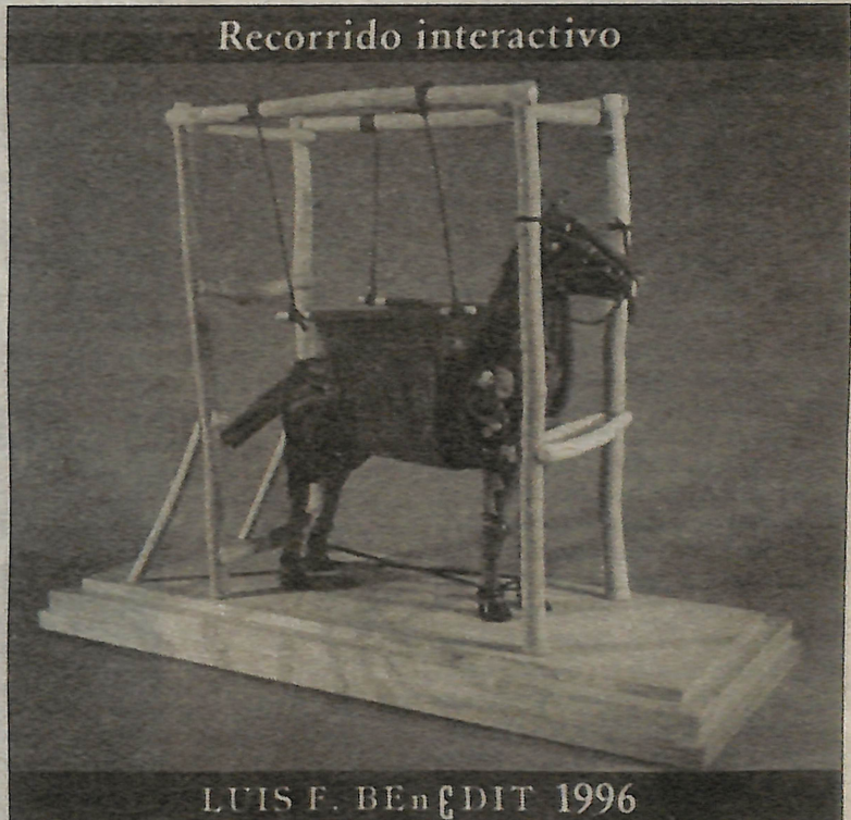
Del material informatizado: el CD que reseña la obra del pintor Luis Benedit, de 1960 a 1996.